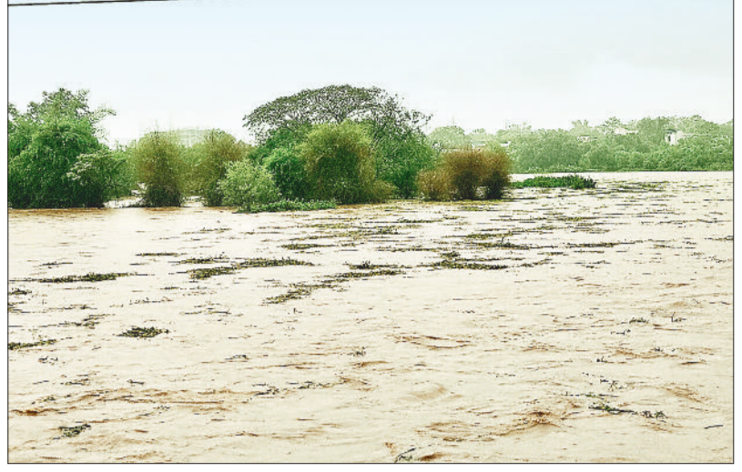
पिछले कई दिनों से हो रही तेज बारिश के कारण अरपा लबालब, बह रहे पेड़ और लकड़ियाँ।

जिले में अलर्ट जारी : रह रह कर हो रही बारिश से आम लोग त्रस्त