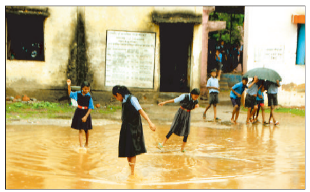
स्कूल परिसर में पानी खेलते बच्चे।

दो दिन से सुबह और शाम हो रही बारिश के कारण सबसे अधिक प्रभावित स्कूलों बच्चे हो रहे हैं। शहरी क्षेत्र में ही 10 से अधिक स्कूलों में पानी भर गया और एक तरह से बच्चों की छुट्टी करनी पड़ी। मोपका, सेंदरी, सिरगिट्टी, तिफरा, बंधवापारा के स्कूलों में जो बच्चे पहुंचे थे उन्हें मध्याह्न भोजन भी नहीं मिला। कलेक्टर संजय अखवाल के निर्देश पर सभी ब्लाकों के बीईओ ने अपने क्षेत्र के स्कूलों का दौरा किया। इस दौरान नगोई प्राथमिक और मिडिल के साथ बेलसरी प्राथमिक और मिडिल स्कूल में पानी भरा मिला। इन स्कूलों में कीचड़ और पानी के बीच बच्चों की क्लास लगी।