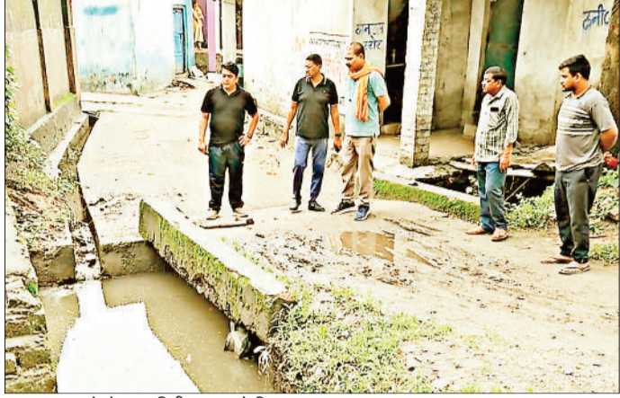
जलभराव वाले क्षेत्र का निरीक्षण करते निगम आयुक्त।

उल्लेखनीय है कि विगत दिन अधिक वर्षा के दौरान बालको क्षेत्र के शांतिनगर बस्ती में जलभराव की समस्या पैदा हो गई थी, जिसके कारण वहाँ के रहवासियों को मुश्किलों का सामना करना पड़ा था, शांतिनगर बस्ती व रिंग रोड के समीप होने वाले जलभराव की समस्या से स्थाई निजात वहाँ के निवासियों को मिले, इसके मद्देनजर आयुक्त आशुतोष पाण्डेय ने स्थल पर