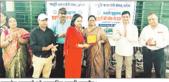
सहयोग सदस्यों को सम्मानित करती महापौर।

हरिभूमि न्यूज ►► कोरबा प्रशांति वृद्धाश्रम के संचालन के 20 वर्ष पूर्ण होने पर रविवार को कार्यक्रम का आयोजन किया गया।