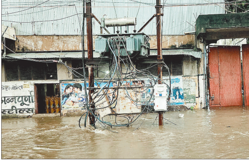
तोरवा मुख्य मार्ग स्थित बिजली का ट्रांसफार्मर का स्वीच बोर्ड पानी में डूबा।