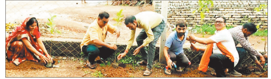
हरिभूमि न्यूज ►► कोसला-पामगढ़