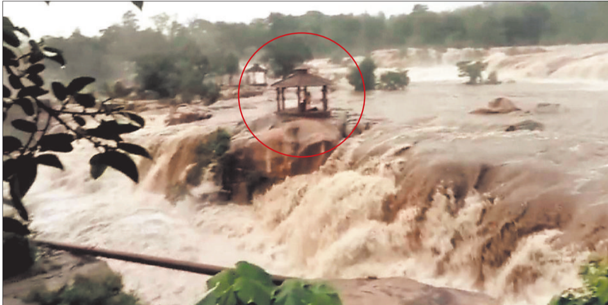
देवपहरी जलप्रपात जहां लाल घेरे में फंसे हुए युवक युवतियां।