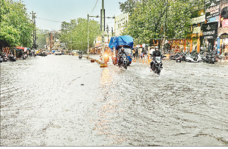
पुराने बस स्टैंड की सड़क पर लोगों का चलना हुआ मुहाल।