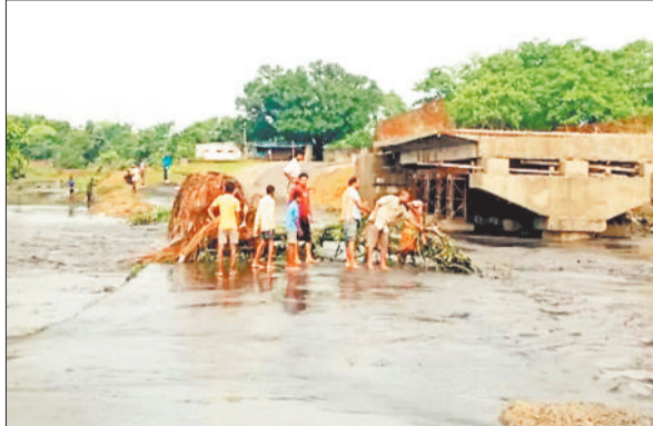
घटनास्थल जहां बह गया वृद्ध।