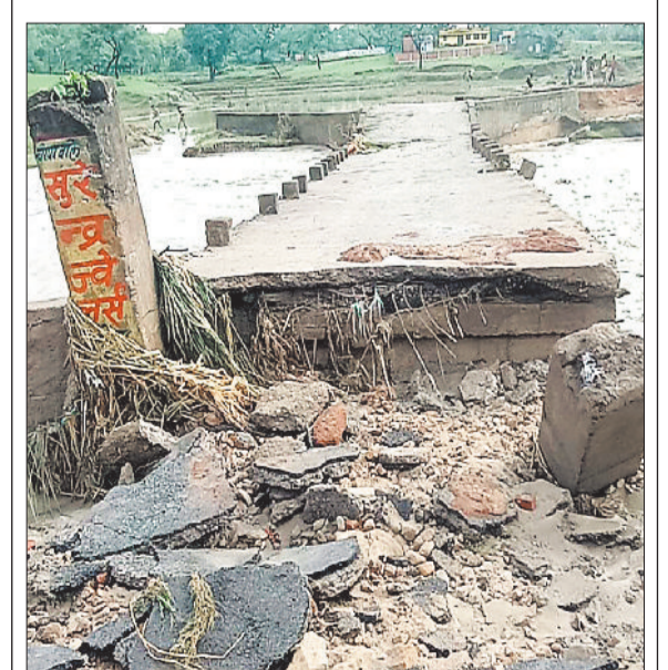
देलावडीह में मूसलाधार बारिश के कारण पुल टूटने से कई गांव का संपर्क टूटा गया है। ग्राम देवरी, कोरबा के बीच में नदी का पुल टूट जाने से दीपका से बांकीमोगरा का संपर्क पूरी तरह से टूट चुका है। जिससे आसपास के ग्रामीण और बांकीमोगरा से देवरी होते हुए दीपका जाने वाले लोगों को कई किमी घूमकर जाना पड़ रहा है, जिससे आम लोगों को भारी परेशानी का सामना करना पड़ रहा है।