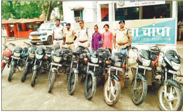
गेरी की बाइक सहित गिरफ्तार आरोपी।

ट्रेनों और स्टेशन प्लेटफार्म पर यात्रियों को खान-पान का सामान बेचने वाले स्टॉल और फूड संचालकों के यहां कार्बन कर्मचारियों के पहचान पत्र, मेडिकल और अन्य दस्तावेज को रेलवे लेती है, ताकि किसी तरह की