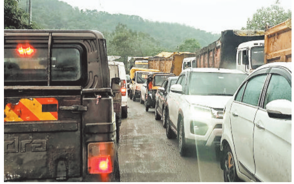
सर्वमंगला कुसमुण्डा मार्ग में लगा जाम।