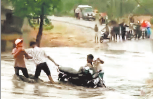
बाढ़ में फंसे बाइक को निकालते युवक।