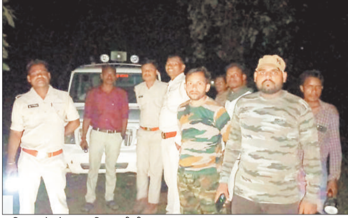
रात्रि गश्त के दौरान वन विभाग की टीम।

उल्लेखनीय है कि जिले के कोरबा वनमंडल में हाथियों का बसेरा है। सबसे ज्यादा कटघोरा वनमंडल में हाथियों का विचरण क्षेत्र है। मौजूदा स्थिति में कैदई और एतमानगर रेंज में हाथियों का झुंड विचरण कर रहा है। इन दिनों हाथी दर शाम होते ही जंगलों को छोड़कर बस्तियों की ओर रुख करते हैं क्योंकि बस्तियों के बाड़ी में लगे केले के पेड़, मक्का और घरों में रखे धान और महुआ उन्हें अपनी और आकर्षित करता है। यही वजह है कि बारिश के दिनों में अक्सर हाथियों का झुंड जंगल को छोड़कर बस्तियों में ही घुसता है और इसी दौरान हाथी और मानव द्वंद की घटना सबसे ज्यादा होती है। बीते कुछ वर्षों के दौरान यह देखने को पाया गया है कि ज्यादातर घटना इसी दौरान सामने आती हैं। हालांकि एक दिन पहले सरभोंका के केसरपुरा बस्ती में घुसने की कोशिश कर रहा था लेकिन वन विभाग