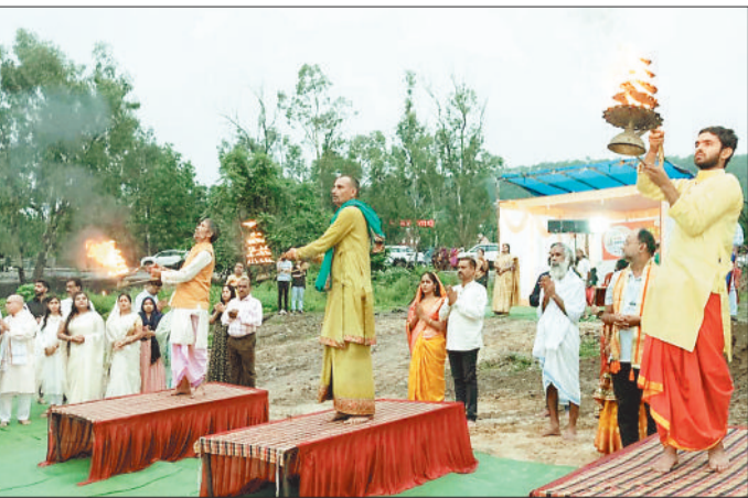
सर्वमंगला घाट में हसदेव आरती करते समिति के सदस्य।

हिन्दू धर्म की आस्था नगरी वाराणसी के मां गंगा आरती की तर्ज पर कोरबा में भी मां सर्वमंगला घाट में हसदेव आरती का आयोजन किया गया। इस दौरान महापौर संजु देवी राजपूत सहित विभिन्न समाजसेवी संस्था के पदाधिकारीगण व बड़ी संख्या में गणमान्य नागरिक शामिल हुए। नमामि हसदेव सेवा समिति द्वारा देवशयनी एकादशी के शुभ अवसर पर रविवार की शाम 5 बजे मां सर्वमंगला घाट पर हसदेव आरती की गयी। इस दौरान समिति द्वारा आयोजन सम्बन्धी व्यवस्था की गयी थी। आरती के दौरान मां सर्वमंगला घाट पर भक्तों