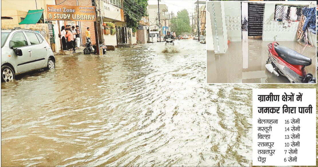
शिव टांकीज से टिकरापारा जाने वाली सड़क पर पानी भरने से लोग हो रहे परेशान। इनसेट में तालापारा में घर के अंदर घुसा पानी।

मौसम विभाग के अनुसार चक्रवाती परिसंचरण 7.6 किमी ऊपर तक फैला हुआ है, यह चक्रवाती हवाएं झारखंड और उत्तरी छत्तीसगढ़ के बना हुआ है। वहीं द्रोणिका का प्रभाव श्रीगंगानगर, सिरसा, मेरठ, वाराणसी, डाल्टनगंज और पश्चिम बंगाल तक फैला चुका है। निम्न दबाव का क्षेत्र बनने के कारण प्रचा में कई जगहों पर भारी वर्षा की चेतावनी जारी की गई है। इस बीच पिछले 6 दिनों से हो रही बारिश के कारण शहर की सड़कों का हाल बेहाल है, जहां एक ओर पानी की निकासी की समस्या से लोगों का सामना हो रहा है, वहीं सड़कों भी उखड़ चुकी है। जूना बिलासपुर, शिव टांकिज चौक, करबला रोड, दयालबंद, तोरवा, चांटीडीह जैसे जगहों पर सड़कें उखड़ चुकी है, इन सड़कों पर चलना भी दूभर हो चुका है।