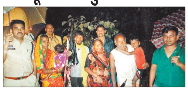
रेस्क्यू कर निकाले गए बाढ़ पीड़ित ग्रामीण।