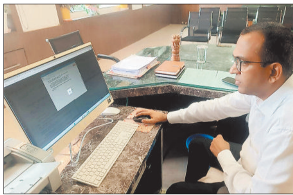
ई-ऑफिस में डिजिटल सिग्नेचर करते कलेक्टर।

ई-ऑफिस में जाकर कलेक्टर ने डिजिटल हस्ताक्षर कर फाइल में दी स्वीकृति